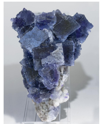
Fluorita - La Viesca, Espanya 14.5 x 10.8 cm