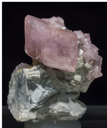
Smithsonita - Tsumeb, Namíbia 4.8 x 3.4 cm