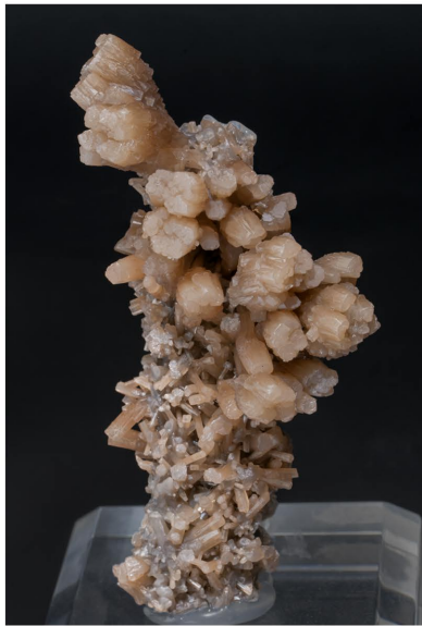
Piromorfita - Rosenberg, Alemanya 7.5 x 4 cm

Ens veurem a Sants o a Madrid. Com podreu veure si assistiu a qualsevol d'aquestes dues exposicions hem tornat plètòrics de Tucson i amb uns exemplars magnífics! ;-)