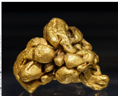
Or - Concesiones Zapata, Veneçuela 1.2 x 0.9 cm