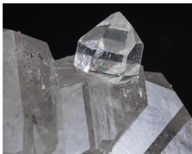
Quars - Berbes, Espanya Cristall principal: 1.5 x 1.5 cm