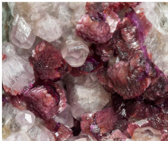
Roselita-beta - Marruecos Roseta: 0.6 x 0.5 cm