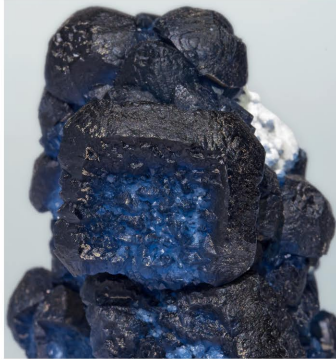
Fluorita - Huanggang, China Cristal: 2.2 x 1.9 cm