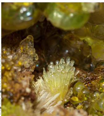
Ópalo - Zacatecas, México Cristales: 0.5 x 0.4 cm