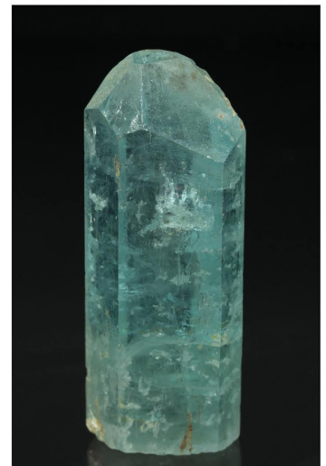
Berilo - Minas Gerais, BRASIL