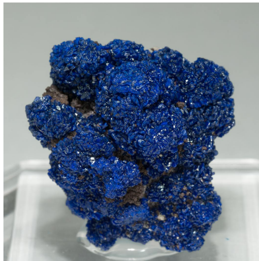
Azurita - Mina San Telmo, Huelva, ESPAÑA