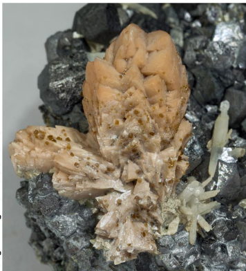
Genthelvita - Mina Huanggang Cristal: 1.5 x 1 cm