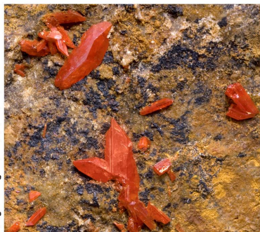
Crocoita - Callenberg, ALEMANIA Cristal: 0.7 x 0.3 cm.