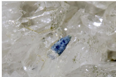
Bazzita - Bonneval, FRANCIA Cristal: 0.2 x 0.1 cm.