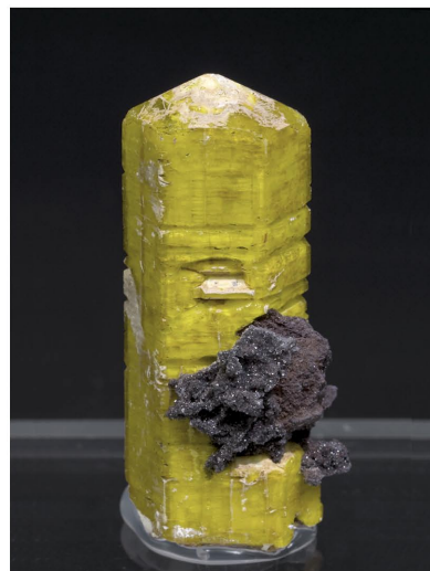
Sturmanita - N'Chwaning II, SUDAFRICA 3.5 x 1.6 cm.