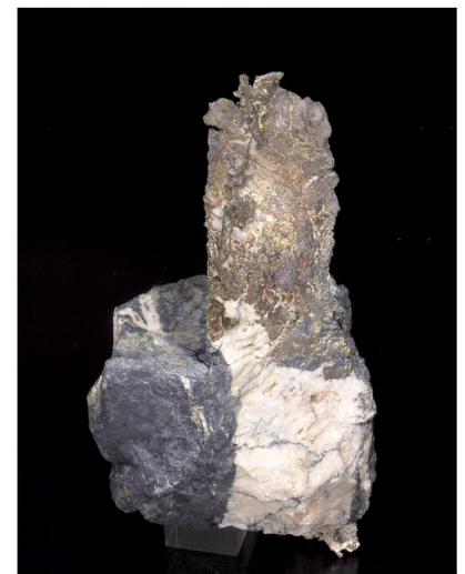
Plata - Imiter, MARRUECOS 13.5 x 7.3 cm.