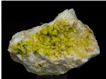
Promorfita - Roughton Gill, UK 11.5 x 9.5 cm.