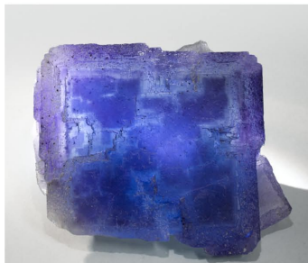
Fluorita - La Viesca, España 10 × 8.4 cm.