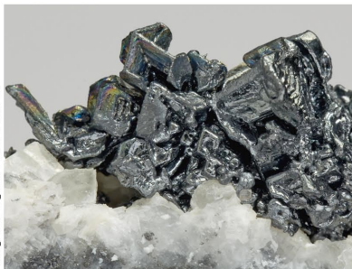
Acanthita - Fresnillo, México cristal mayor: 1 × 0.2 cm.