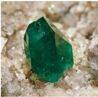
Diopside - Tsumeb, Namibia cristal: 0.7 × 0.5 cm.