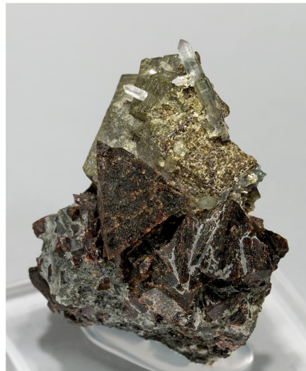
Genthelvita con Andradita - Huanggangliang, China 4.1 × 3.7 cm.