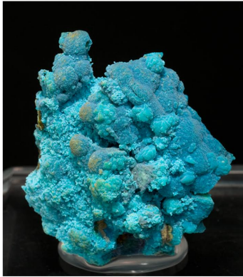
Crisocola - Pozo San Enrique, Jaén 3.5 × 3.1 cm.