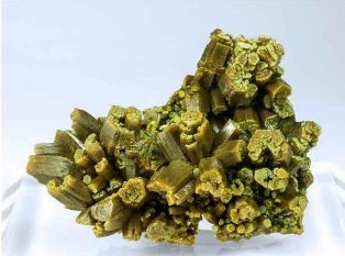
Pyromorfita - Mina Des Farges, FRANCIA 1 x 0.8 cm