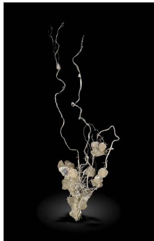
Plata con Calcita - Depósito Jizishan, CHINA 9 x 3.2 cm