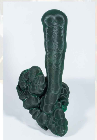
Malaquita - Mina Shilu, CHINA 16.5 x 8.5 cm