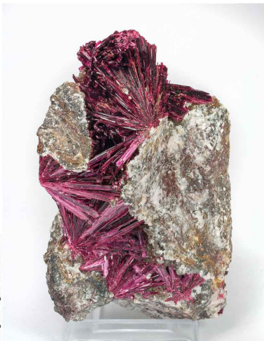
Erythrita - Mina Bou Azzer, MARRUECOS 10.1 x 6.2 cm