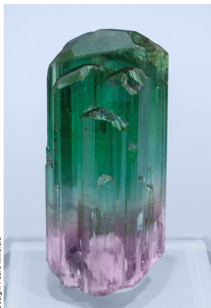
Elbaite - Bevaondrano, MADAGASCAR 5 x 2.5 x 2.3 cm