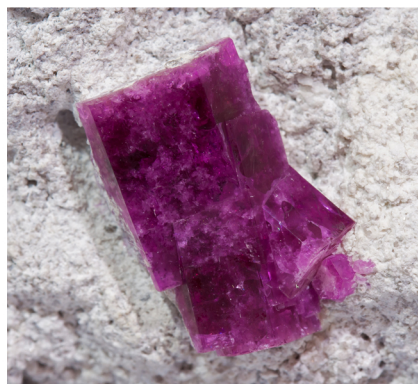
Beryl (variety bixbite) - Utah, USA cristall: 1.6 x 1.3 cm