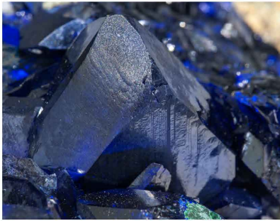
Azurite - Chessy, France Cristal: 1.8 x 1.4 cm