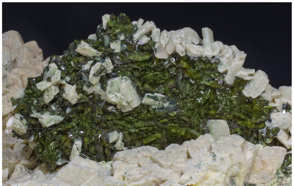
Titanita sobre Rutilo pseudomórfico Ilmenita y con Microclina - Imilchil, Marruecos