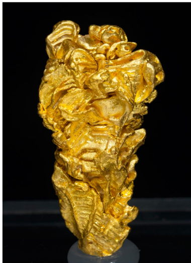
Oro - Serra do Caldeirão, BRASIL 3.2 x 1.6 x 1.2 cm Esta pieza es portada de la revista "Lapis"