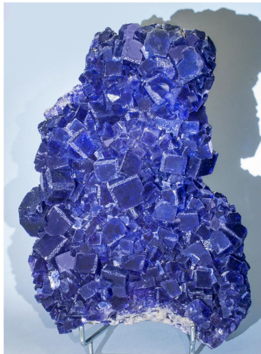
Fluorita - La Viesca, ESPAÑA 23.5 x 17.5 x 6.5 cm