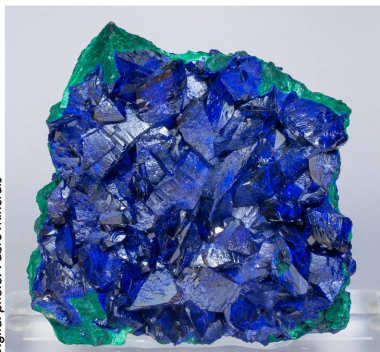
Azurita - Mina Milpillas, MÉXICO 7.6 x 7.5 x 1.8 cm