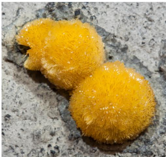
Valentinita - CHINA Grupo de cristales: 0.8 x 0.8 cm