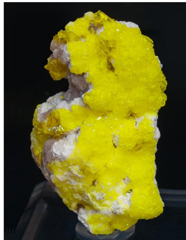
Jouravskita - SUDÁFRICA