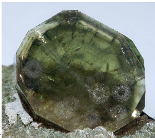
Fluorapatito - Panasqueira, PORTUGAL