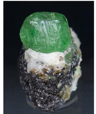
Grossularia (var. tsavorita) - TANZANIA Cristal: 1.4 x 1.3