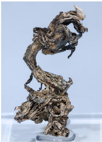
Plata - Kongsberg, NORUEGA 3.6 x 1.6 cm