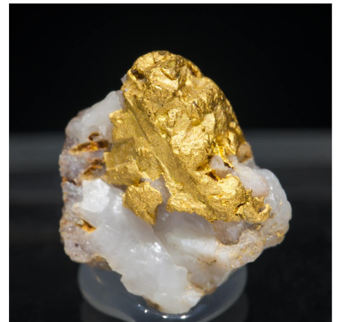
Or - Talarrubias, Badajoz, Espanya 1.2 × 1 × 0.7 cm