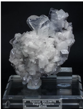
Dolomita - Eugui, Espanya 14.5 × 11.4 × 8.7 cm