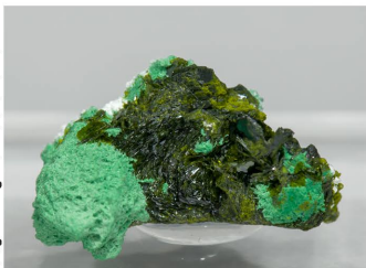
Volborthita - Milpillas, Mèxic 1.3 × 1 × 0.9 cm