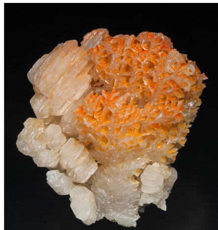
Mimetita en Cerussita - Nakhlak Mine, Iran 4.9 × 4 × 3.1 cm