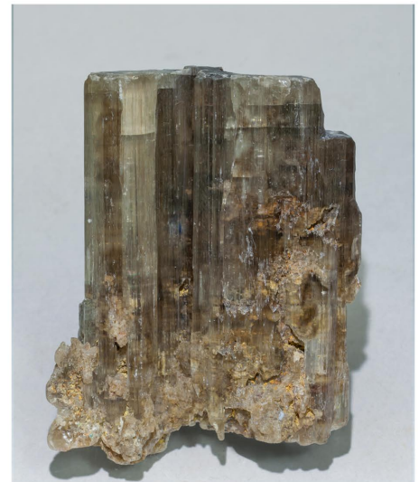
Phosgenita - Mina Monteponi, Itàlia