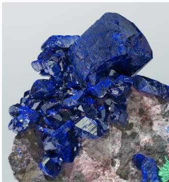
Atzurita - Milpillas, Mèxic Cristall: 2 x 1.6 cm