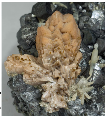
Genthelvita - Mina Huanggang Cristall: 1.5 x 1 cm