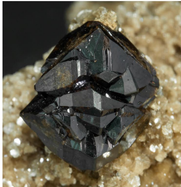
Cassiterita - Panasqueira Cristalls: 1.6 x 1.2 cm