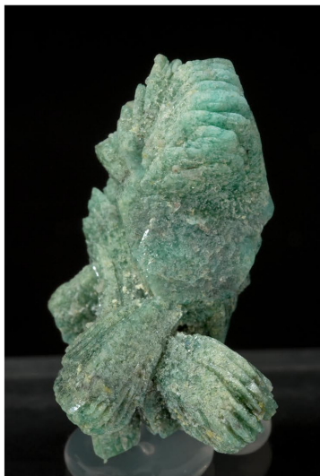
Borcarita - Mina Huanggang, Xina 2.6 x 1.7 cm