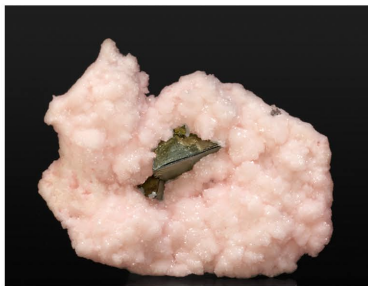
Tetrahedrita - Mina Boldut, RUMANIA 5.8 x 4.4 cm.