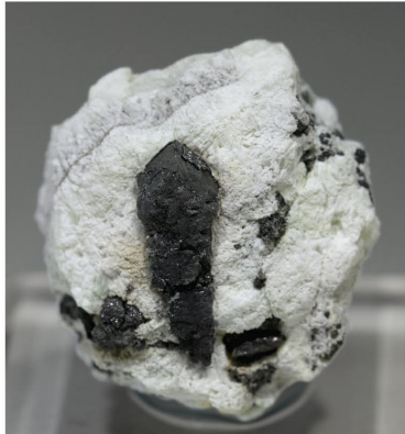
Villamaninita - Villamanin, Lleó 2.7 x 2.5 cm.