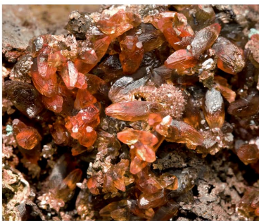
Rodocrosita - Alemanya Cristalls: 0.5 x 0.3 cm.