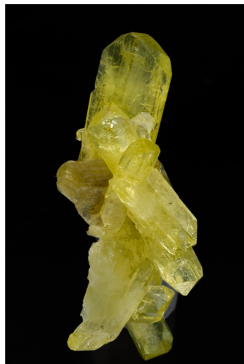
Brasilianita - Linópolis, Brasil 5.3 x 2.5 cm.