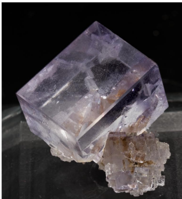
Fluorita - Cantera Llamas, Duyos, Astúries 1.9 x 1.5 cm.