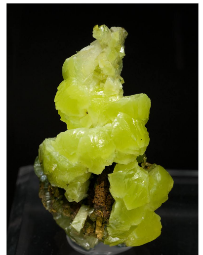
Adamita - Mapimí, MÈXIC 6.3 x 3.8 cm.